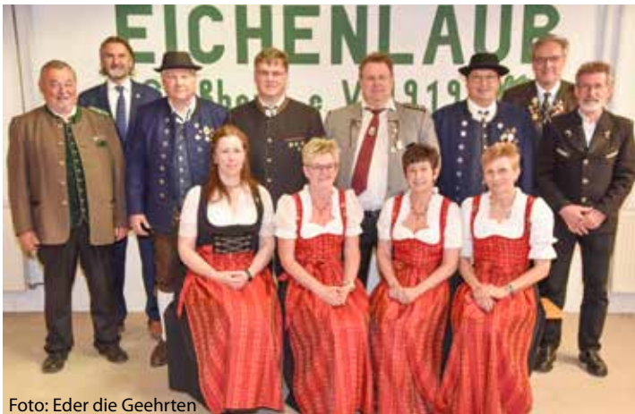
die Geehrten