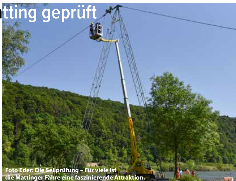
Die Seilprüfung – Für viele ist die Mattinger Fähre eine faszinierende Attraktion.

In Matting betreibt die Gemeinde Pentling, die einzige noch verbliebene Gierseilfähre im Landkreis Regensburg. Ihr Betrieb ist seit 169 Jahren (23. April 1854) genehmigt. Sie liegt am Donau-Radweg in Matting (Gemeinde Pentling). Sie verbindet den Ort