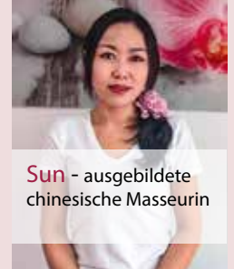
Sun - ausgebildete chinesische Masseurin

Ein Geschenk für Wohlbefinden und Schönheit