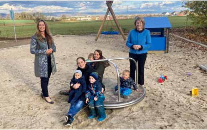
Die abgebildeten Personen haben - auch für ihre Kinder - einer Veröffentlichung zugestimmt

CSU-Stadträtin Dagmar Schmidl setzte sich erfolgreich für den vorgezogenen Bau am Stadtfeldweg ein. Im Februar 2023 nahm die örtliche Stadträtin Dagmar Schmidl die Nachfrage von Oberislinger Eltern zum Baubeginn des für das Neubaugebiet geplanten Spielplatzes am Stadtfeldweg auf und initiierte mit der CSU-Fraktion einen entsprechenden Brief an die Oberbürgermeisterin. Nach für die Anwohner enttäuschender Rückantwort,