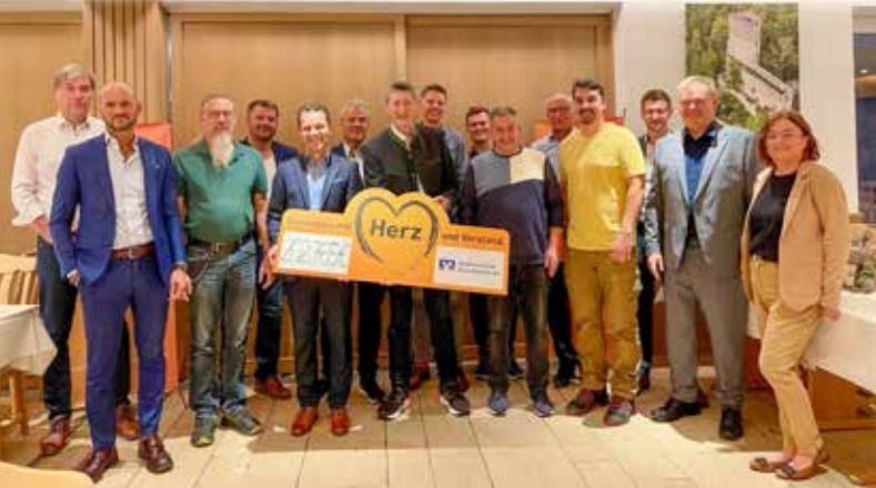
Gewinnspärüberreichung der Raiffeisenbank Kreis Kelheim eG

Kelheim. Mit Spenden aus dem Gewinnspär Zweckertrag 2023 in Höhe von insgesamt 202.765 Euro konnte die Raiffeisenbank Kreis Kelheim soziale und gemein-