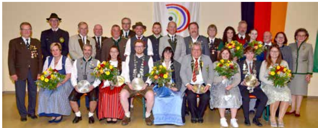
Die Könige